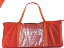
便利な収納袋入り